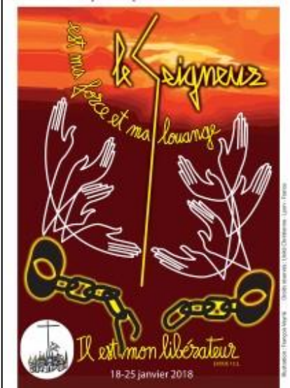
Semaine de prière pour l'Unité Chrétienne

Les communautés chrétiennes de différentes confessions de notre secteur se retrouvent pour prier pour l'unité à l'Eglise Baptiste de Massy, vendredi 26 janvier à 20h30.